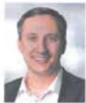
Verfasst von Martin Steinmeyer

Rückgewinnung von Kunden. Da nur die wenigsten Kunden betroffenen Unternehmen ihre Abwanderung vorab mitteilen, ist ein schnelles und gut überlegtes Handeln von großer Bedeutung. So genannte „One-Lost-Order“-Analysen, also die systematische Untersuchung verlorener Verkaufschancen, helfen beispielsweise, wenn der Kunde bereits dem Unternehmen den Rücken gekehrt hat, die Gründe für seine Abwanderung zu analysieren. Dann können spezifische Maßnahmen eingeleitet werden, um ihn zurückzugewinnen. Ein strukturierter Prozess, der schnelle Reaktionen und individuelle Angebote beinhaltet, kann zusätzlich entscheidend sein, um Käufer wieder an Bord zu holen. ■